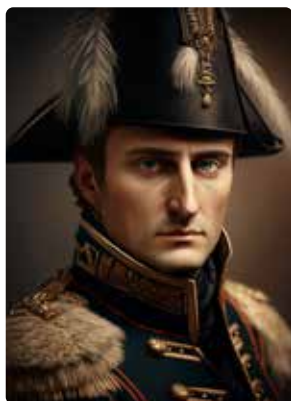
11. července 2026 XVII. ročník Dobývání dobšických sklípků