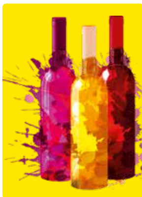
10. října 2026 IV. ročník Dobšického vinobraní