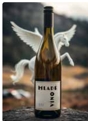
13. listopadu 2026 Svěcení mladých vín